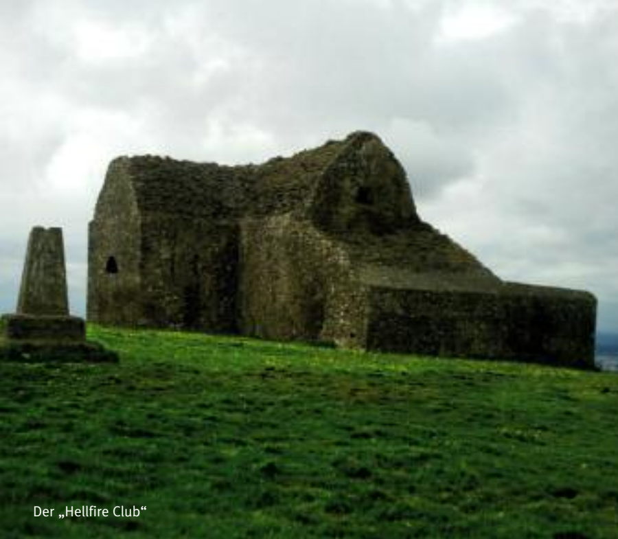
Der „Hellfire Club“