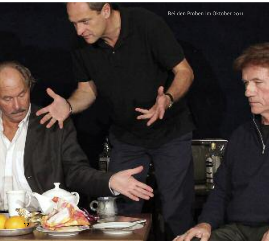
Bei den Proben Im Oktober 2011