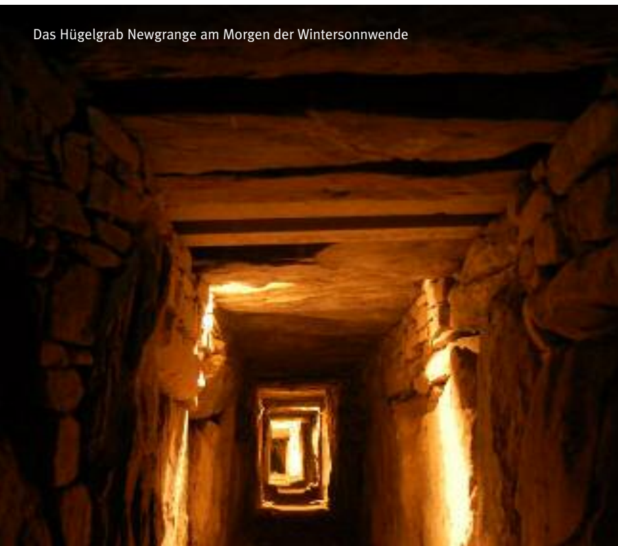
Das Hügelgrab Newgrange am Morgen der Wintersonnwende